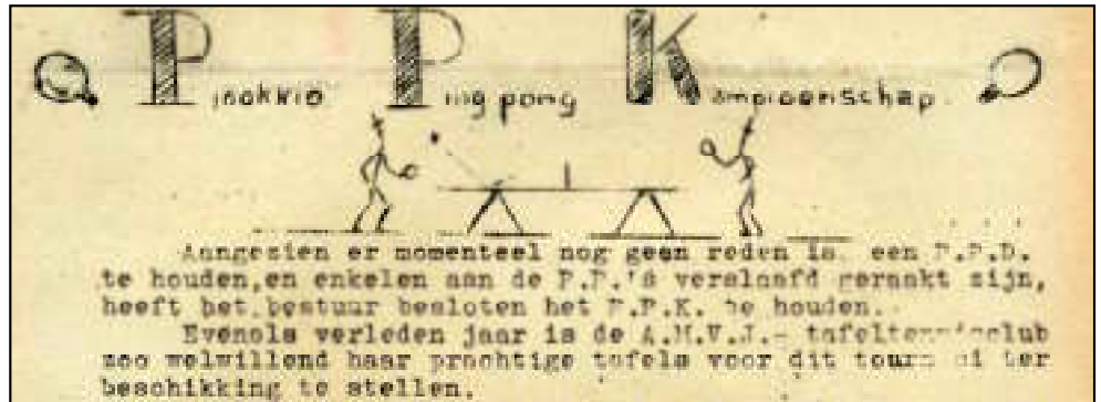
↑ Steekneus 6 februari 1936.

Bewijzen van andere sportieve activiteiten vinden we in de Steekneus van Pinokkio. Het geeft duidelijk aan dat de club, toen nog meer dan nu, een ontmoetingsplaats was. Het huidige aanbod van faciliteiten is natuurlijk ook niet te vergelijken met toen.