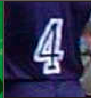
EN ANDERE SPORTACTIVITEITEN