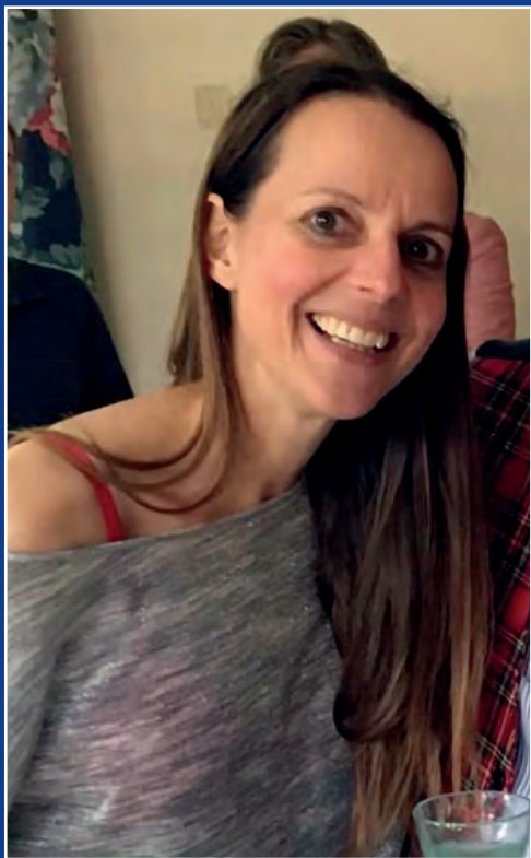
Bieb Tuyt Fotografe