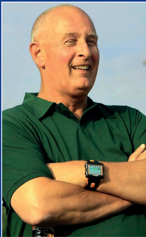
Bonno Mijnlief Razende Reporter